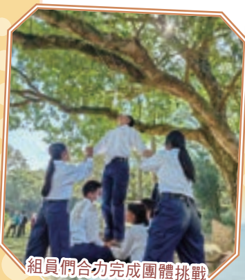
組員們合力完成團體挑戰

透過參與不同的挑戰，學生不但對自己加深認識、更有信心，並通過與人合作提升了溝通能力。