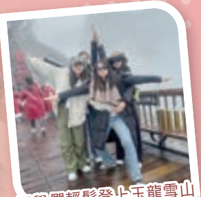
同學們輕鬆登上玉龍雪山