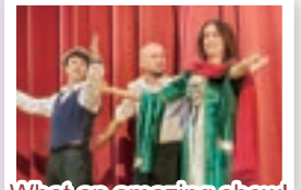
What an amazing show!