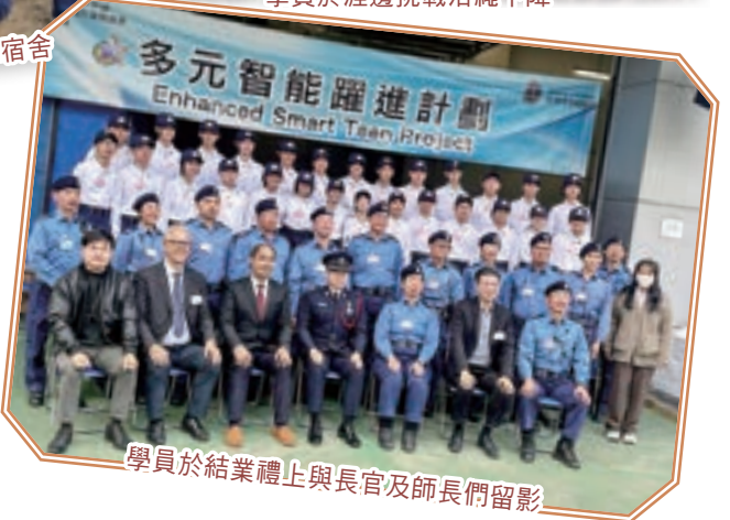
學員於結業禮上與長官及師長們留影