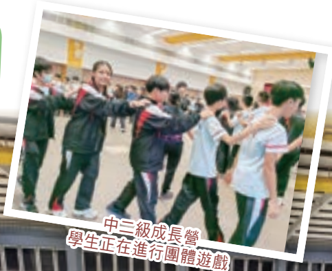
中三級成長營 學生正在進行團體遊戲