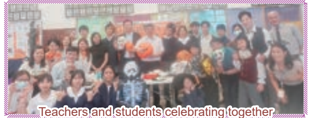
Teachers and students celebrating together