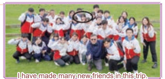
I have made many new friends in this trip.