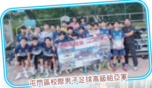
屯門區校際男子足球高級組亞軍