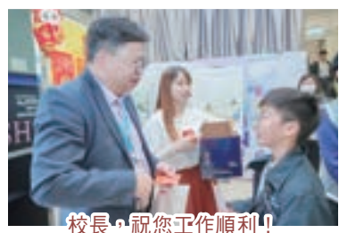
校長，祝您工作順利！