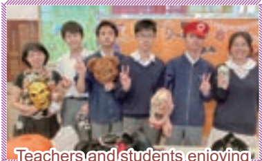
Teachers and students enjoying scary masks

It was the same at Sun Hoi. Students and teachers had fun celebrating Halloween.