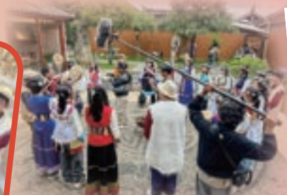
當地旅遊聯盟拍攝學生學習跳民族舞，在各媒體推廣雲南旅遊