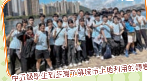
中五級學生到荃灣了解城市土地利用的轉變