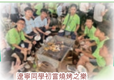
遼寧同學初嘗燒烤之樂