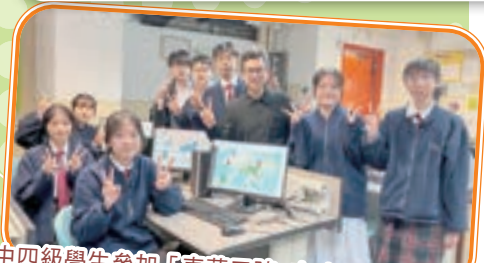
中四級學生參加「東華三院x市建局」青年領袖計劃24-25，學習使用地理數據分析系統。

地理科為中四至中六級選修地理科學生舉辦不同的實地考察活動，以鞏固所學，擴闊眼光。