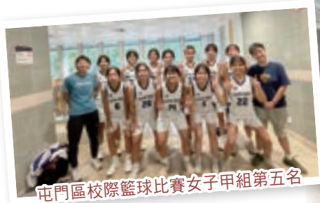
屯門區校際籃球比賽女子甲組第五名

辛亥體育團隊成員參加多項體育比賽，如屯門區校際田徑、越野和游泳賽、東華三院中學聯校運動會及各校際球類比賽，均獲得優異成績。