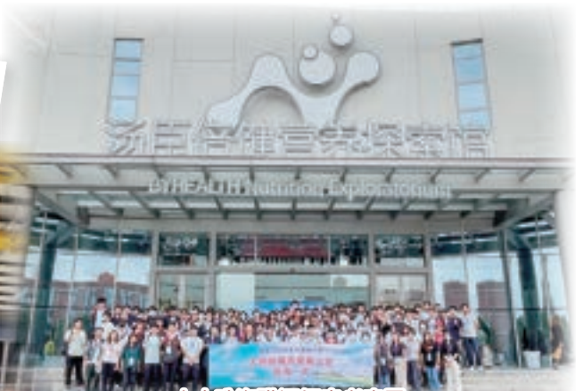
中大珠海職涯探索考察團 參觀湯臣倍健營養探索館