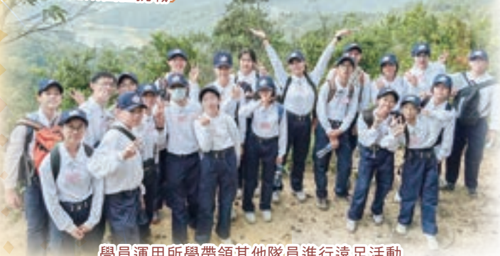
學員運用所學帶領其他隊員進行遠足活動