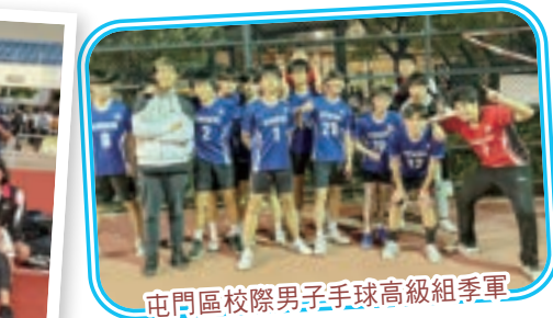
屯門區校際男子手球高級組季軍