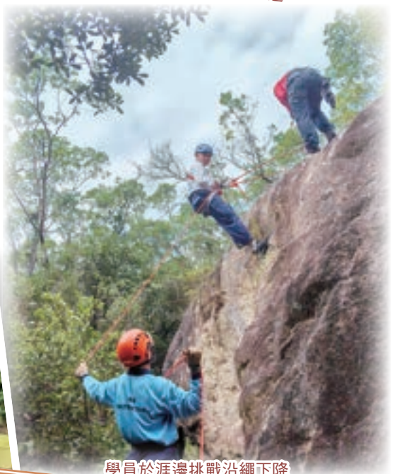
學員於涯邊挑戰沿繩下降