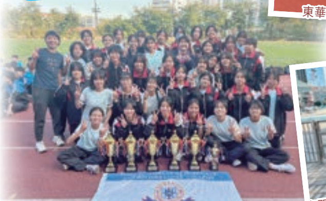
屯門區校際田徑比賽女子組總亞軍