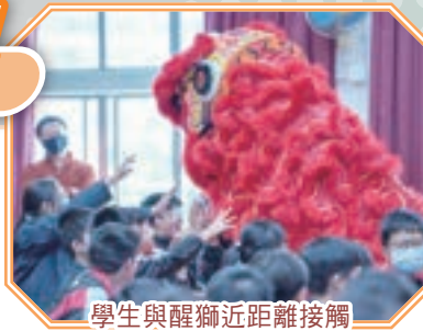
學生與醒獅近距離接觸

鑼鼓一響，醒獅出場，為中華文化周展開序幕。中文及普通話科在農曆新年前舉行「中華文化周」，主題為「中華節慶——春節」。中華文化周以「醒獅表演及互動體驗」周會打響頭炮，兩頭龍精虎猛的醒獅走到觀眾席，讓學生近距離接觸中國傳統的製作工藝。在互動環節中，學生即場體驗舞動醒獅，嘗試疊羅漢的動作，又學習敲打鑼鼓，親身感受非遺的魅力。