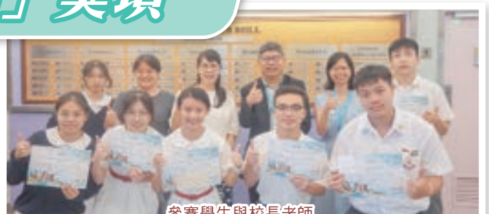
參賽學生與校長老師

本校中四級及中五級學生參與教育局和中國文化研究院合辦的「2023/24公民與社會發展科網上閱讀獎勵計劃」，本校榮獲「十八區卓越表現獎（屯門區）第三名」及「最積極參與學校獎」，分別獲得五百元及六百元書券。