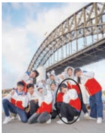
At the Sydney Opera House

In retrospect, she learned more about teamwork with others. What an incredible journey!