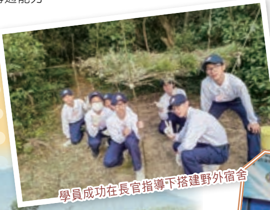
學員成功在長官指導下搭建野外宿舍