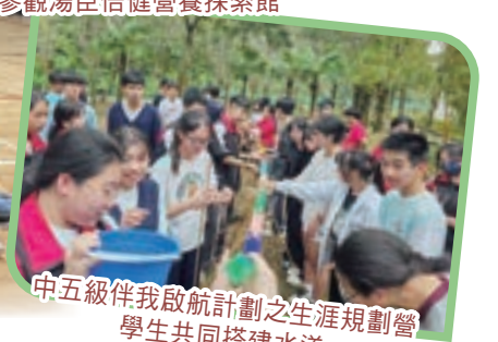
中五級伴我啟航計劃之生涯規劃營 學生共同搭建水道