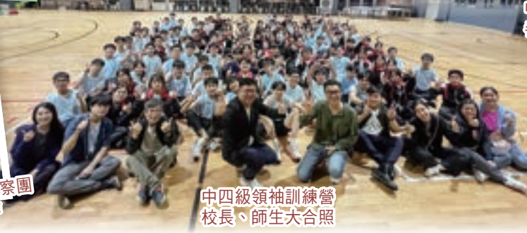
中四級領袖訓練營 校長、師生大合照