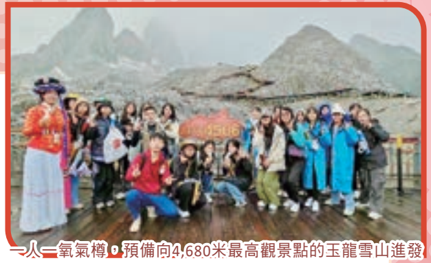
一人一氧氣樽，預備向4,680米最高觀景點的玉龍雪山進發

是次考察走訪雲南省昆明、大理和麗江三地，包括：雲南白藥企業、祿豐恐龍博物館、大理古城、洋人街、喜洲古鎮、麗江古城、四方街、東巴文化博物館、玉龍雪山、冰川公園、雲南民族博物館、金馬碧雞坊、昆明老街。其中一天行程為探訪納西族家庭，學生穿著納西族服裝跟當地居民學寫東巴文字、體驗石磨豆花、搞打乾草造紙，及在庭園歡天起地跳民族舞，了解雲南歷史及傳統民族文化。是次考察團獲雲南旅遊聯盟攝製隊隨行，將考察團在納西族的歡欣體驗紀錄下來，並製作宣傳短片在各媒體播放。學生走出課室學習，深入體會青少年在國家發展中的機遇，對國民身份的認同感倍增。