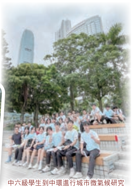
中六級學生到中環進行城市微氣候研究