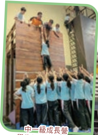
中一級成長營 學生協力越過高牆