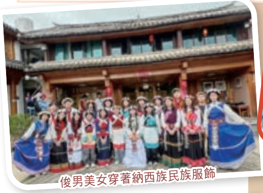
俊男美女穿著納西族民族服飾