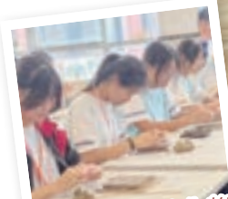
中三級佛山嶺南文化考察團 學生進行手工製作