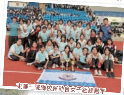
東華三院聯校運動會女子組總殿軍