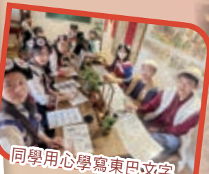
同學用心學寫東巴文字