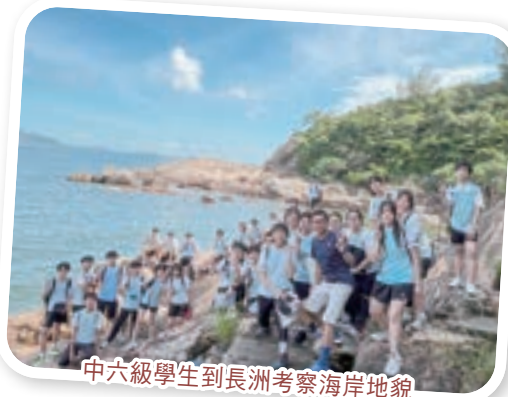
中六級學生到長洲考察海岸地貌