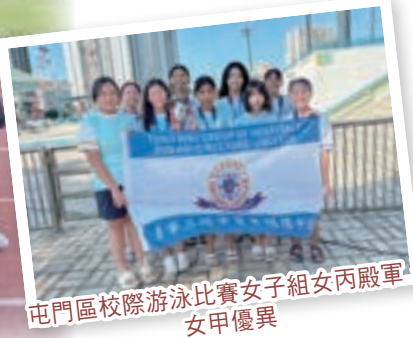
屯門區校際游泳比賽女子組女丙殿軍、女甲優異