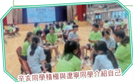
辛亥同學積極與遼寧同學介紹自己

東華三院教育科在7月18日至19日主辦「遼港青少年交流團」，接待遼寧省實驗學校回訪。姊妹學校遼寧省實驗學校張麗文校長早在2016年已特意來港參與本校35周年校慶，是次更帶領眾師生到港參與東華聯校活動，加深兩地學生的情誼。