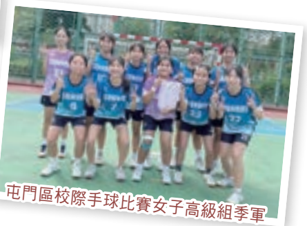
屯門區校際手球比賽女子高級組季軍