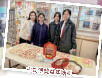
中式傳統賀年糖果